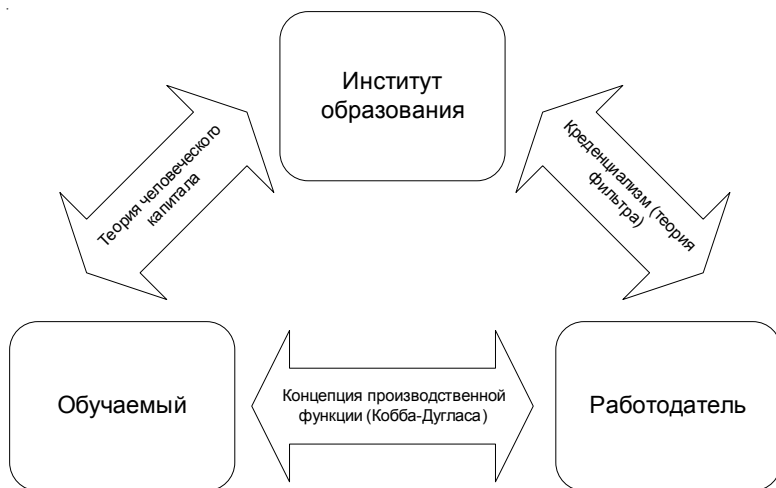
Рис. 1. Экономическая эффективность образовательной деятельности с точки зрения различных теоретических концепций

концепций не дала ответа на вопрос о возможности прикладного измерения результатов образования.