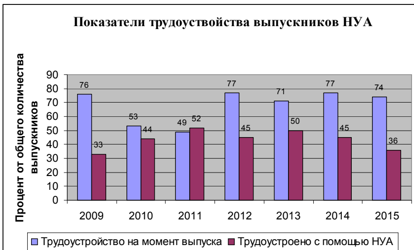
Рис. 2. Показатели трудоустройства выпускников НУА

Мы гордимся ещё и тем, что, используя все преимущества частного образования (значительную автономию, широкие возможности для творческого поиска, мобильность выбора форм