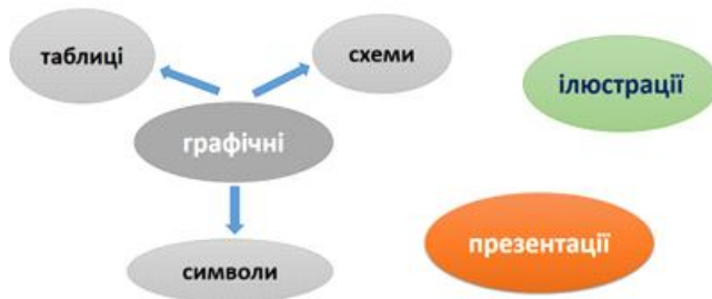
Рис. 1. Види візуалізації

В педагогічній практиці стали звичайними традиційні види візуалізації: