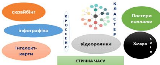
Рис. 2. Види зорової інформації

Сьогодні на своїх уроках вчителі все частіше використовують інноваційні види зорової інформації: