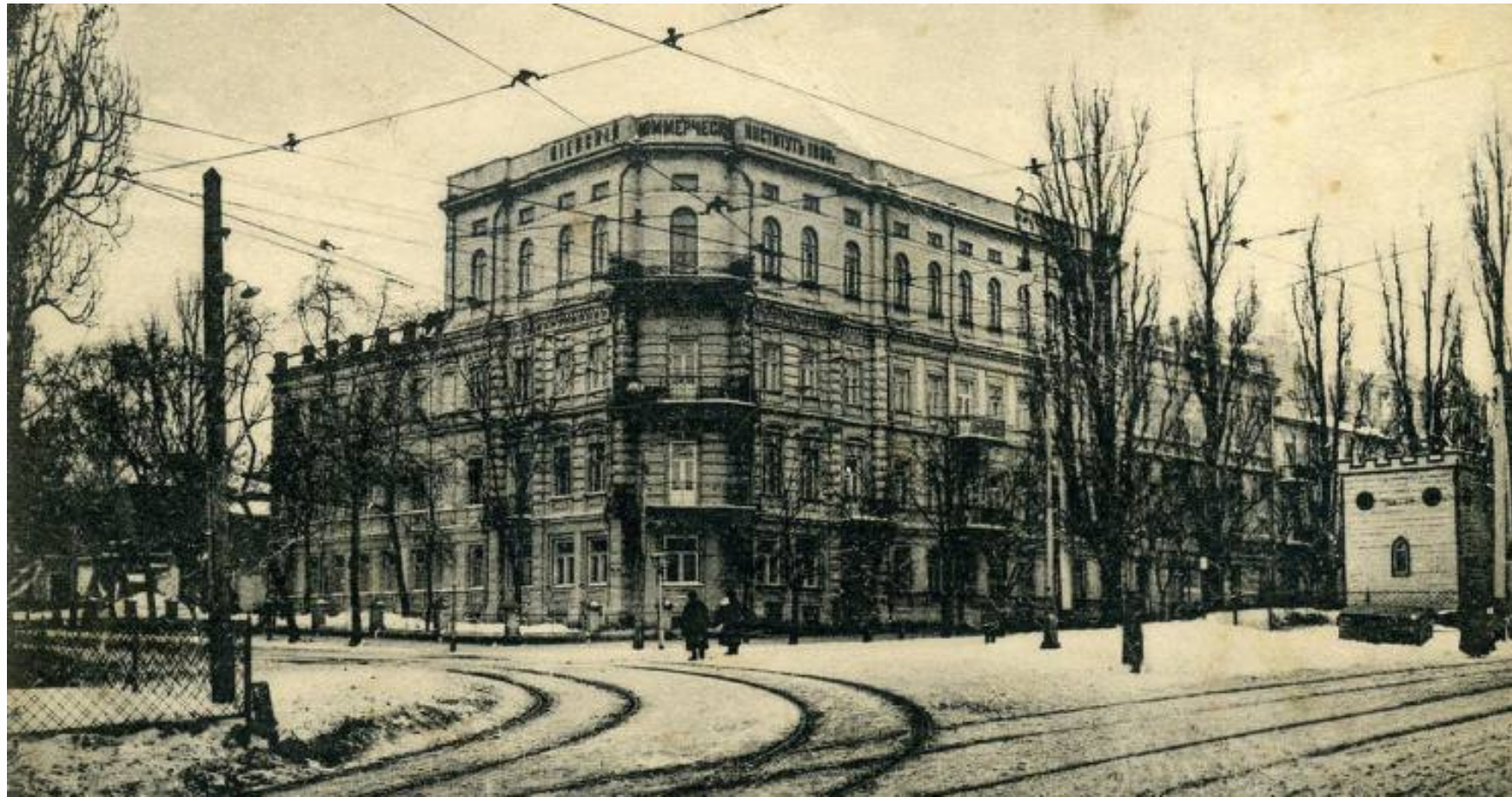
Київський комерційний інститут (1908-1920)