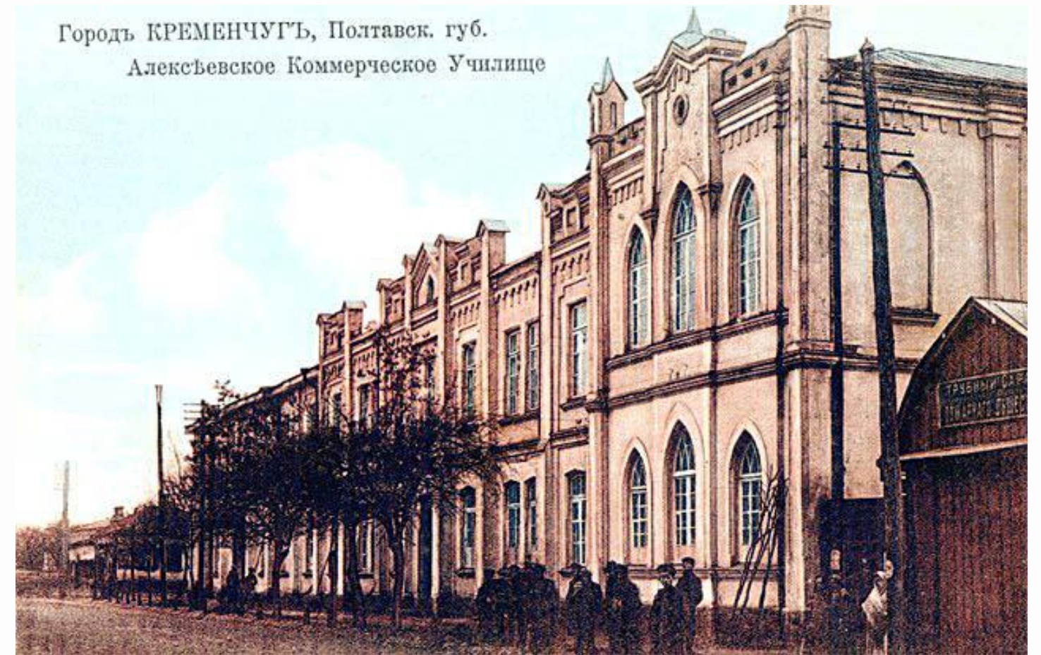
Городъ КРЕМЕНЧУГЪ, Полтавск. губ. Алексѣевское Коммерческое Училище