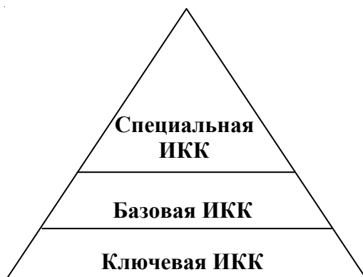
Рис. 2. Уровни ИКК, формируемые в гуманитарном университете

ИКК не сводится к так называемой «компьютерной грамотности». Достижение компьютерной грамотности в университетах, в основном, уже состоялось. Понятие ИКК шире понятия компьютерной грамотности, включает его, опирается на него. Компьютерная грамотность